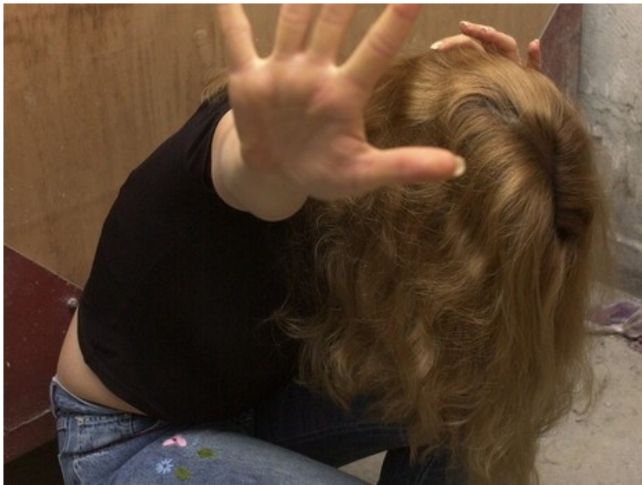
נערה דיווחה שבשנה אחת היא עברה למעלה מ-50 "אירועים פיזיים"