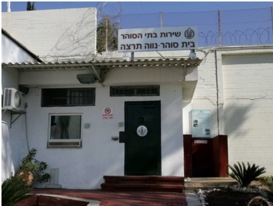
מעדיפות לשבת בכלא נווה תרצה