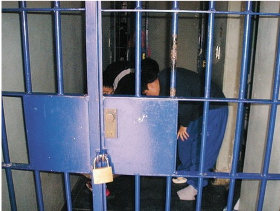
"החדר אטום והחלונות בו מרותכים"

"יש בו חדר שירותים ומקלחת וכן מיטה עם מזרן. אין מצעים על המיטה, כדי למנוע התאבדות בחנק, וניתנת רק שמיכה כבדה. החדר מחניק מאוד ולא ניכרת בו פעילות של כל אמצעי אוורור. נאמר לנו שמשתדלים לא להשאיר נערה בחדר "הרבה זמן" משום שמדובר בחדר מחניק מאוד כשהוא סגור. משיחות שערכנו עם הנערות עלה כי אחת מהן שהתה בחדר הבטוח יומיים שלמים והייתה צריכה להמתין שמונה שעות כדי שיוציאו אותה לשירותים. אותה נערה סיפרה כי שהתה בחדר הבטוח כעונש על הבריחה ולא משום שהייתה נסערת".