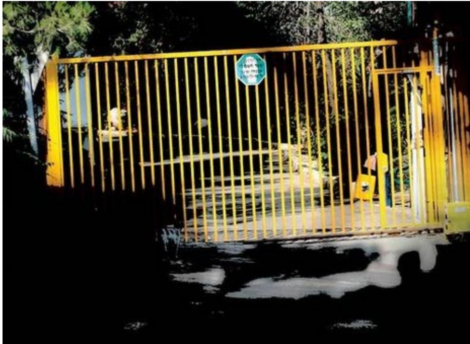
שער מעון "מסילה"