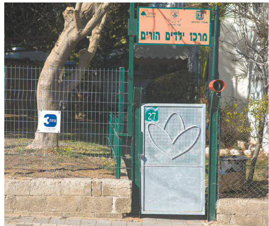
מרכז קשר בנס ציונה. "אסור לנו לטפל באנשים שמגיעים", אומרת ד' שהועסקה במרכז כזה

יוני, גרוש ואב לילדה: "זה נראה כמו תעשייה שלמה. לא ייתכן שבמדינת ישראל מוציאים כל כך הרבה ילדים למרכזי קשר. לא ייתכן שברגע שאתה מתגרש, אתה הופך פתאום להורה בסיכון שמידרדר למקום כזה"