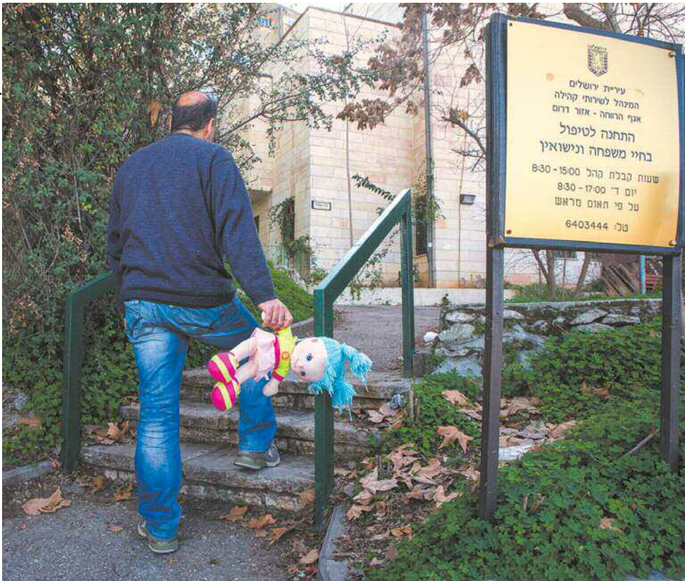
יוני, גרוש ואב לילדה בת 12. החליט לוותר על המפגשים במרכז הקשר ולא ראה את בתו שנתיים