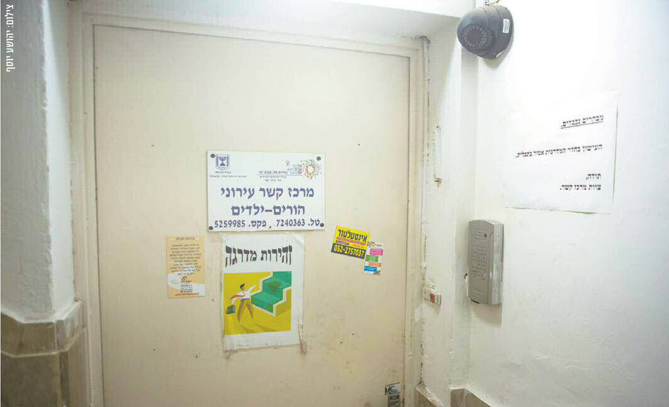
מרכז קשר בתל אביב. "כשהמדרין במרכז הקשר היה אומר 'זהו, מספיק', אני תמיד הייתי מבקש עוד קצת, עוד קצת עם אמא", מספר אחד הילדים