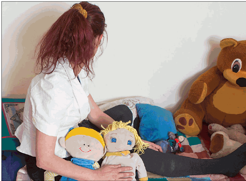
יונית: "בדרך הבינה, סיפרה לי אחת הבנות שהמדריכים נכנסים אליהן בלילה למיטה. שמכאיבים לה באיבר המין"