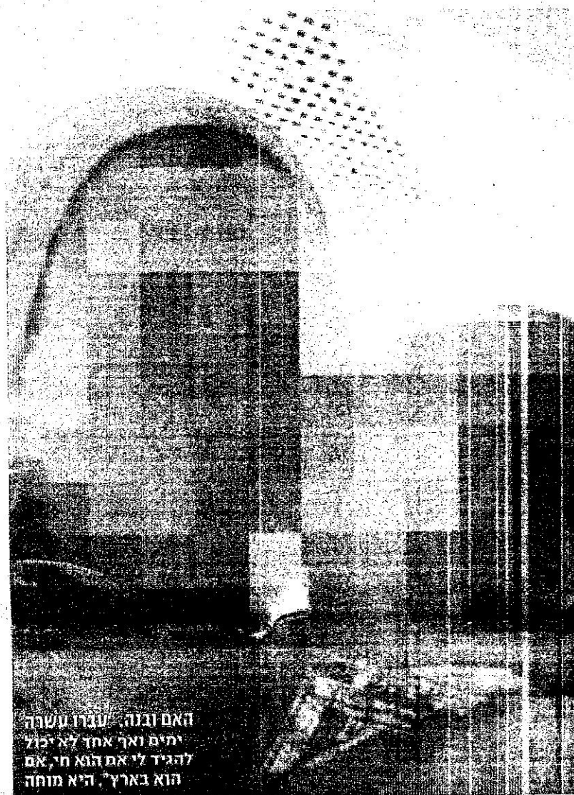
האם ובנה / עברו עשרה ימים ואך אחד לא יכול להגיד לי אם הוא חי, אם הוא בארץ. היא מוחה

בסוך גירושין הגיע אב לגן של בנו לפני עשרה ימים, לקח אותו ונעלם • האב ישב בעבר בכלא על נ. "הוא מסוכן", מזהירה האם שנמלטה ממנו למעון לנשים מוכות • פרקליטתו: "הילד לא בסיכון"