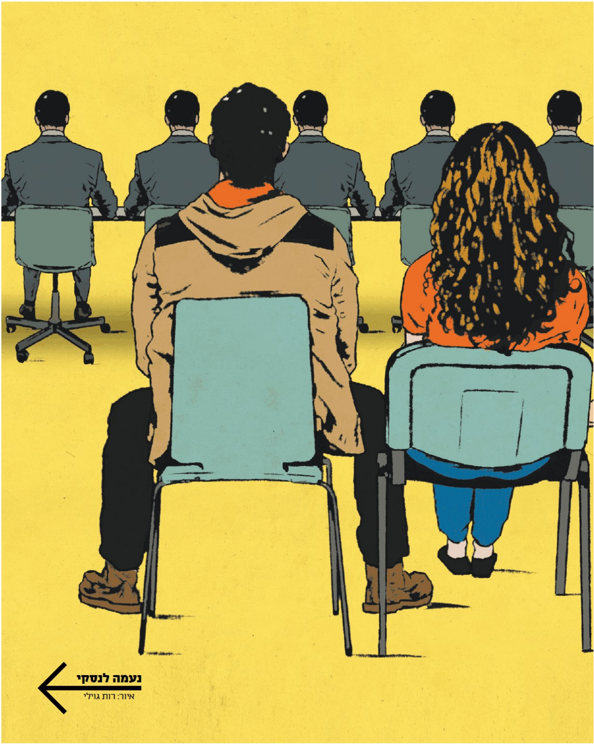
← נעמה לונסקי איור: דות גילי