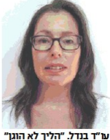
ע"ד בנדל. "הליך לא הוגן"

מרבית הילדים לקוי מוסרו: מוטה, לא שוויגי ורומס זכויות של הורים וילדים. "זאת חוויה אלימה, אין לי מילה אחרת", אומר י', עובד סוציאלי שלקח חלק בעשרות ועדות החלטות. הוא בעל תואר שני בעבודה סוציאלית וזה שבע שנים עובד במסגרות שונות במערכת הרווחה, שמטעמן הוא נשלח לוועדות. "לעולם אובדן את ועדת ההחלטה הראשונה שהשתתפתי בה. הייתי המום ומטולטל. הרגשתי שמדל זולים באמת שישבה שם, שמתייחסים אליה כמו אל