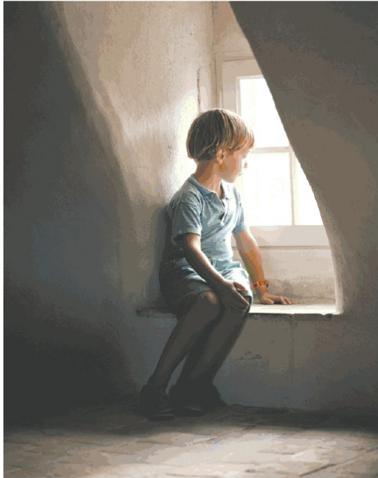
"אתה יכול לרעור על דו"ח חניה ולא יוכל לרעור על הוצאת ילד מהבית", אומרת ש'

"הכל נסמך על הנחות פנימיות מהרג המנהלי הכי נמוך, שאין מה להשוות בינו לבין חוק או תקנות, מבחינת רמת המחויבות להן. כלומר, אפשר לחרוג מהן, אפשר לשנות אותן, אין סנקציות משמעותיות שאפשר להטיל אם הן לא נאכפתות. למשל, אם הורה לא יזמן לריון שנוגע לגורל ילדיו, זה לא יפחית מתוקף ההחלטה שהתקבלה. אם, לעומת זאת, היה חוק שקובע שחובה לזמן את ההורה, והוא לא זומן, הרי שזו עבירה על החוק. מציגנו שלא רק שההנחות של תע"ס לא מקיימות במלואן, אלא שיש בהן גם בעיות קשות. למשל, לא מובטח בכלל ארץ יש לקבל את ההחלטה, מה עושים כשיש רעת מיעוט, כמה מחברי הוועדה צריכים לתמוך בהחלטה כדי שתתקבל. הכל נוזל ונחלי בהרכב הוועדה ובלישכת הרווחה המסוימת שבה זה קורה. ואלו החלטות שחן לעיתים מלתי הפיכות ויכולות להסתיים באימוץ. יש כאן פגיעה בזכויות אדם וגם פגיעה בחוסר סמכות. רשות מנהלית לא יכולה לפעול בלי חוק או לפחות תקנות, משמטימיות אותה, כשעל הכף מוטת לוח זכויות אדם, כמו הזכות לחיי משפחה וזכויות של ילד לגדול במחיצת הוריו. אלה זכויות חוקתיות, שאי אפשר לפגוע בהן באמצעות החלטה מנהלית. ידע לפני שלוש חודשים עבר חוק האומנה, שבסגרתו הוסדר חוקית חלק קטן מפעילות הוועדות, שנוגע למשפחות האומנה ומתייחס לזכויות הילדים והורי האומנה. סהרה בו התייחסות להורים הביולוגיים, ובכל מקרה, 80% אחוזים מההוצאות הרוחניות הן לפעילות, כך שהחוק הוא לא רלוונטי לגביהן".