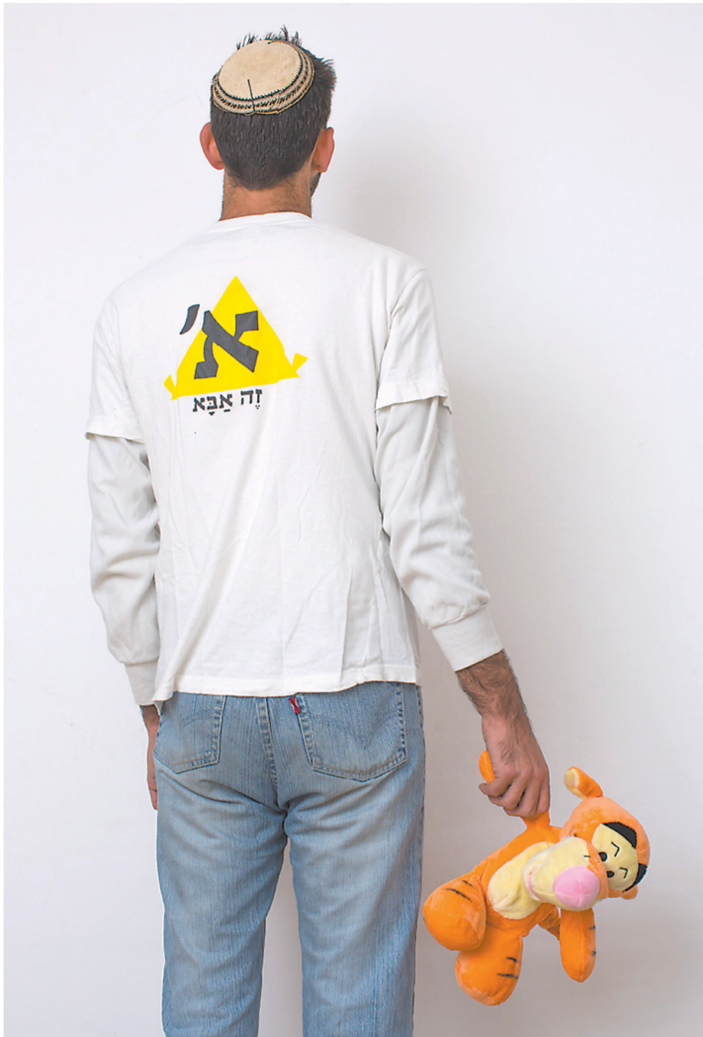
"אין לי מה לעשות, הבת שלי כלואה בידיים של פקיד הסעד"

הוא לקחת את הילד ולהזיז אותו הצידה. יש תפיסה שלפיה בכל בעיה שמתעוררת עם הילד, המשמעות היא או שההורה לא מתפקד או שההורה פועל לא נכון. ומה עם בעיות תורשיות? בעיות קשב וריכוז? דברים שאינם מתחילים ונגמרים בהורים? "אני מכיר מקרה שבו הוצאו שלושה ילדים מהי בית בגלל שהיו חלשים מאוד בלימודים. האמא לא ראתה את הילדים חודשיים, עד שהם הוחזרו אליה. הוצאת הילדים מהבית צריכה להיות המוצא האחרון, לא הראשון. ילד שניתקו אותו מההורה שלו ושהי כניסו לו לראש שהוא לא עם אמא שלו מפני שהיא לא טובה, הופך להיות ילד אחר, ילד פגוע. גורמים לו נזק עצום. בעיניי, הוצאת ילד מהבית זה כישלון מהדהד של הרווחה, לא נקודה לזכותה". ומה קורה כאשר ילד מוחזר אל הוריו לאחר מאבק? ד"ר תמרין טוענת כי משרד הרווחה למעשה נעלם. "הם לא נמצאים שם בשביל לאחות את הקרעים, לשקם את הקשר ולסייע בהתגברות על הטלטלה האיומה שחווה המשפחה. אני מכירה מקרים שבהם, כחלק מסכסוכי שכנים, שכן פנה למשרד הרווחה וסיפר ששמע את שכניו מתעללים בילדיהם. באחד המקרים הצלחתי למנוע את הוצאת הילדים מהבית אחרי שכבר הוצא צו והשוטרים הגיעו והוציאו את הילדים מהמיטות ומהבית. האם מישוה פיצה את המשפחה? האם מישוה סייע לה בשיקום אחרי הרבר הנורא הזה? מה פתאום".