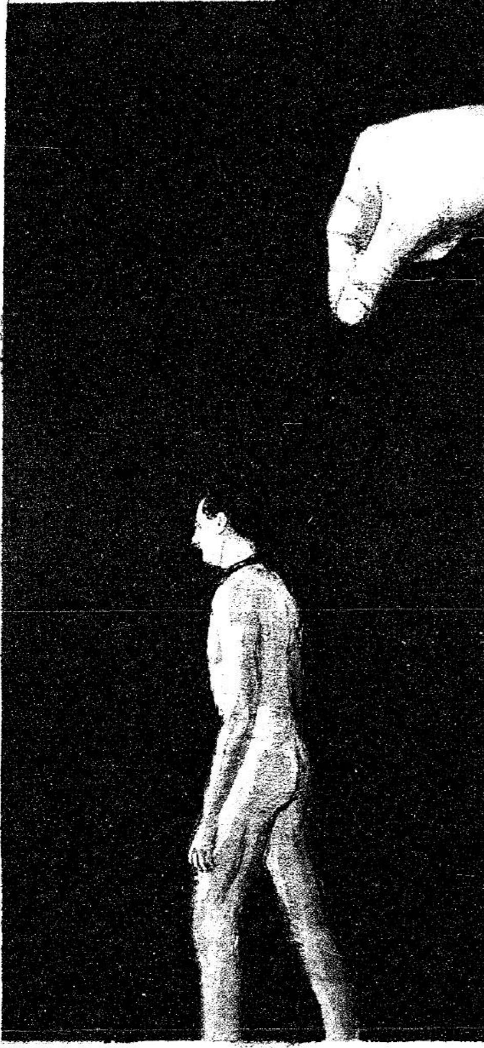
איוה: ניקי אסא

קם בבוקר ומגלה שעשו ממנו פסיכי? סיפורו של האורח ד"ר מ, שנלקח לבדיקה כפויה, ויעזע את המדינה. באחד הערכים, לפני כשנה, ישב מ' לתומו בבית, כשלפתע התפרצו שני בידונים וגדרו אותו בכוח לבדיקה פסיכיאטרית. למרות שהיה בריא לחלוטין.