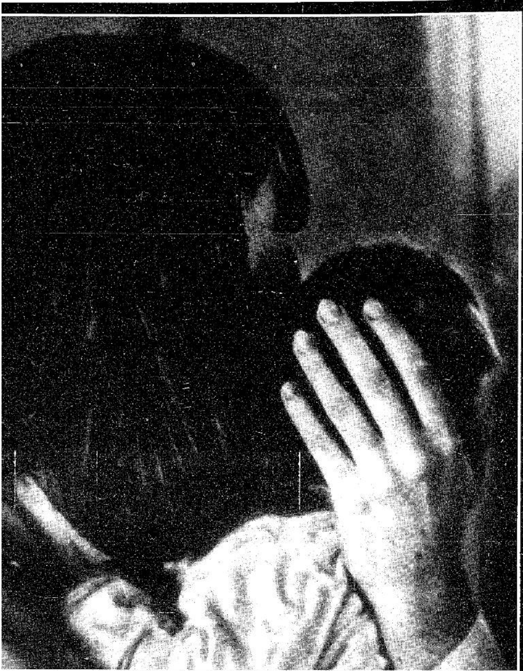
„אמרו לבת שלי שאמא אורלי מתה. היא התחילה כיתה ד', אבל אין לה ראש ללימודים. הילד נשאר כיתה”

הכתבה. הייתי נוסעת לכל מיני אזורי יוקרה, שבהם חשבתי, שישימו את הילדים שלי, כשתובנת עם תמונה ביד ושואלת אנשים, אם מישהו בסביבה אימץ לאחרונה שני ילדים ביחד. הייתי ניגשת לבתי'ספר ומהפסת. למשל בחיפה, אני זוכרת שישב ילד בשער של בתי'ספר ושמר. אמרתי לו, חמוד, תפתח לי, הבת שלי שכחה את האוכל בבית. ואו עליתי לכיתות המתאימות - בשנה שעברה הן למד בכיתה א' והבת בכיתה ג' - פתחתי את הדלת, הכנסתי את הראש פנימה והסתכלתי טוב טוב. כך עשיתי בעשרות מקומות. לא היו תוצאות, אבל לא התייאשתי.'