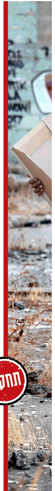
איפה ורד בדסה חטור