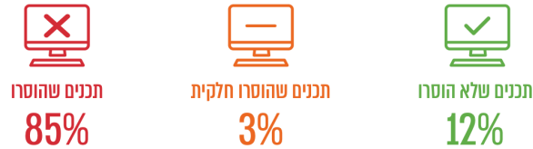
תרשים 47 - התפלגות התכנים המפירים לפי תוצאות הטיפול

- התרשים מתוך דו"ח פרקליטות המדינה לשנת 2017 (נספח ע/2 לעיל), עמוד 47