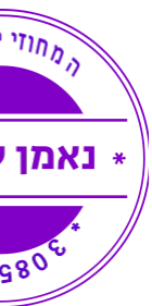
גילה כנפי שטייניץ, שופטת